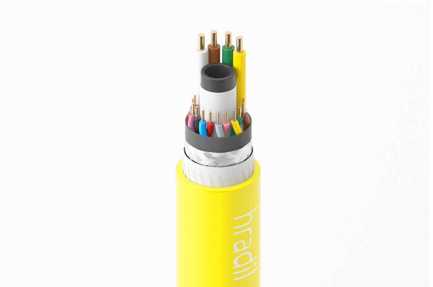
Abbildung 3: Hradil maritimes Daten- und Versorgungskabel für den maritimen Einsatz mit Mini-U-Booten. (Für größere Ansicht, bitte Bild klicken)