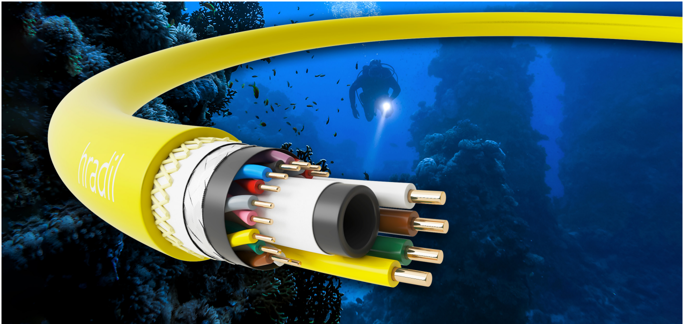
Abbildung 1: Hradil Daten- und Versorgungskabel für den Betrieb von ferngesteuerten Mini-U-Booten zur Meeresforschung und -erkundung. (Für größere Ansicht, bitte Bild klicken)

Viele Forschungsbereiche in der Biologie, Archäologie, Geologie und Meteorologie nutzen die Möglichkeiten ferngesteuerter Überwachungssysteme. Bei der erdnahen Erkundung werden z.B. Drohnen mit Audio-, Video- oder Infrarotsensoren ausgestattet und können sehr gute wissenschaftliche Dienste leisten. Dies ist jedoch bei der Meeresforschung aufgrund der Druckverhältnisse und des Mediums Wasser deutlich schwieriger. Das Problem ist dabei weniger das Mini-U-Boot selbst als vielmehr die Versorgungs- und Datenleitung, die das Mini-U-Boot mit Energie und gegebenenfalls Druckluft versorgt und im Fall der Fälle als Rettungsleine dient.